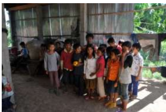
Quelques enfants de l'OCDB

Les visites et rendez-vous ont eu lieu aux dates suivantes :